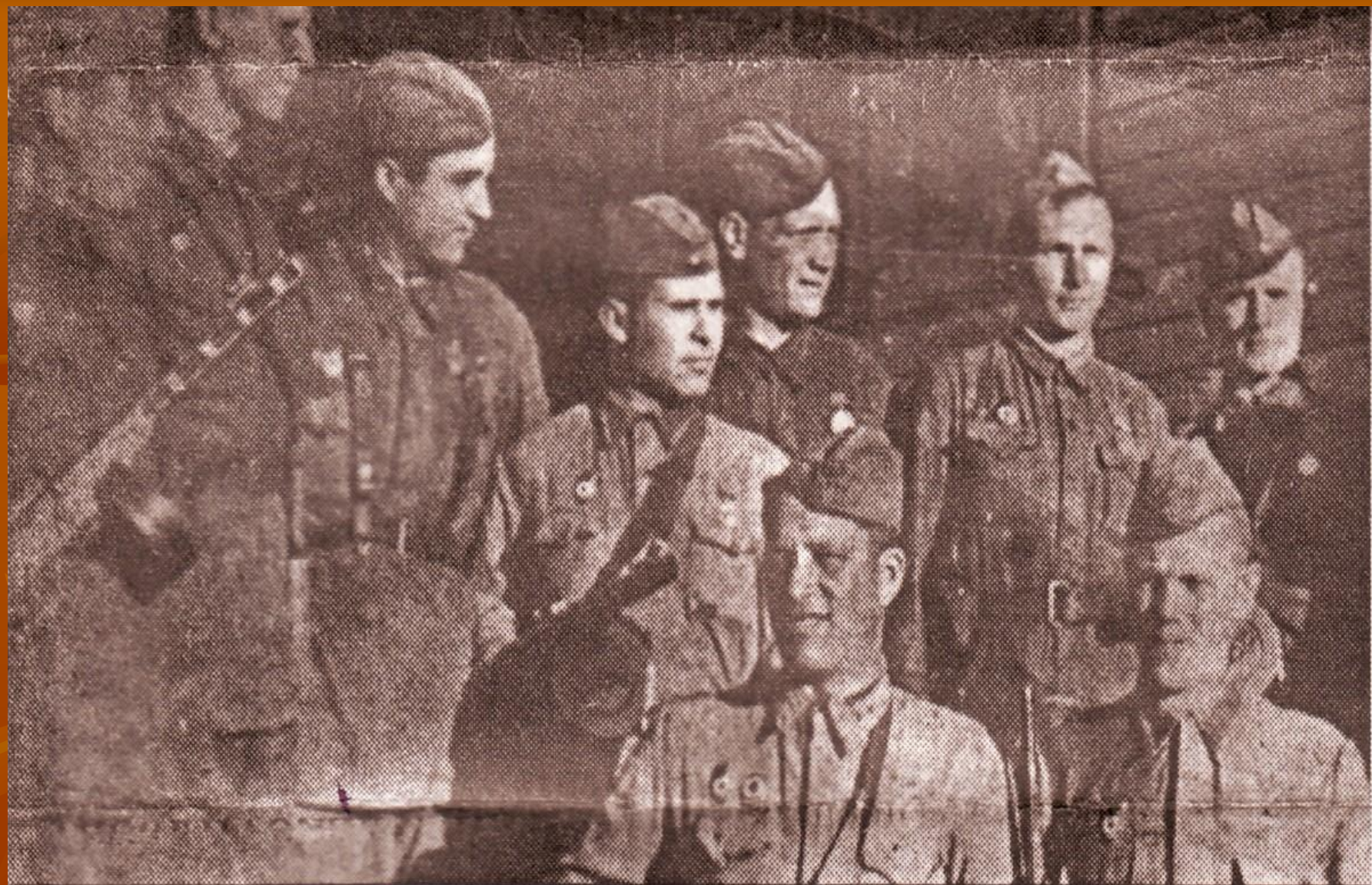
Группа воинов 119-го гвардейского стрелкового полка, награжденных за отличие в бою. 1942 год.