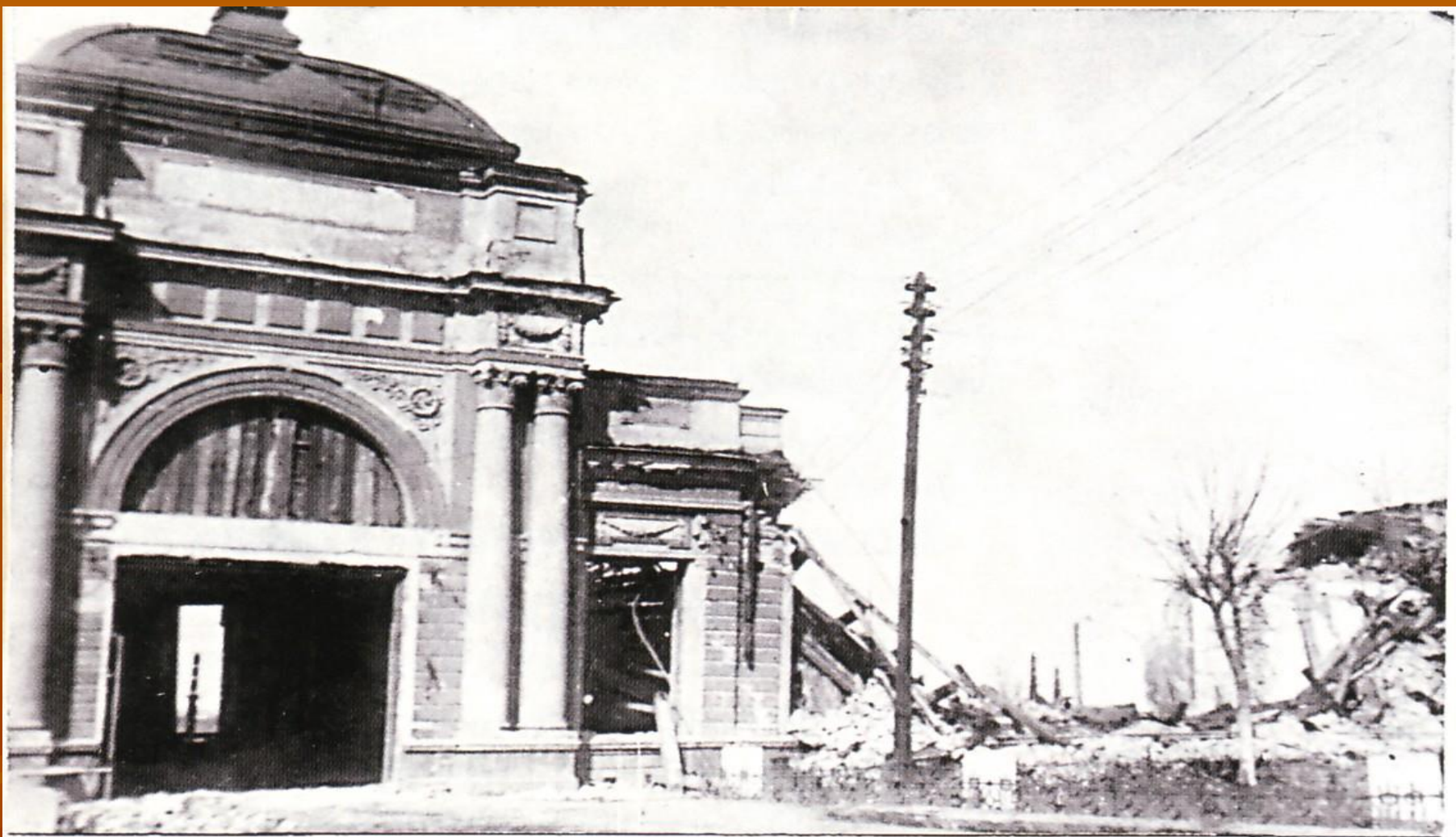
ВЗОРВАННОЕ ЗДАНИЕ ЖЕЛЕЗНОДОРОЖНОГО ВОКЗАЛА