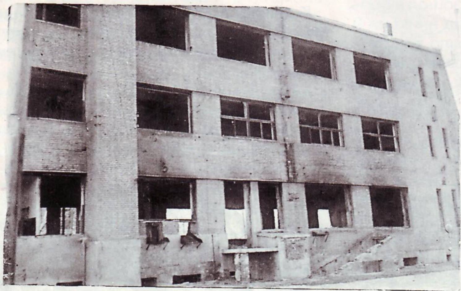
РАЗВАЛИНЫ НА МЕСТЕ ЗДАНИЯ ПОЧТЫ