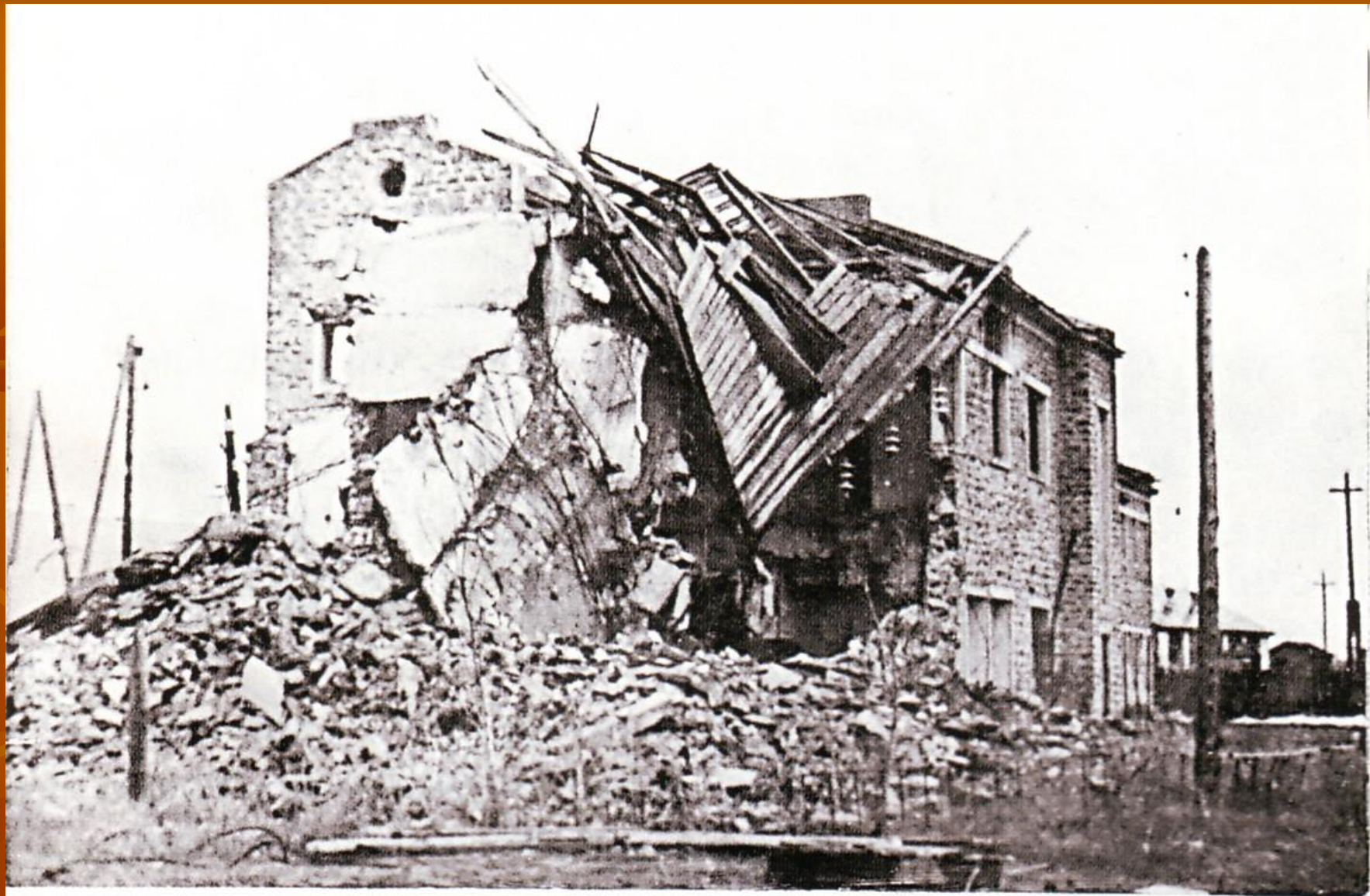
РАЗРУШЕННАЯ ШАХТА ИМ. КРАСИНА