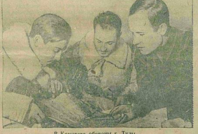
В Комитете обороны г. Тулы. Шахта «Ивановская правда» прочно удерживает...